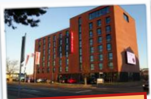
viele weitere Quartiere in Cuxhaven, z.B. Havenhostel 182.- € inkl Frühstück