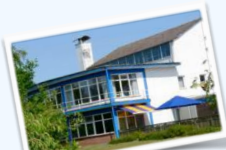
Stella Maris (DZ) 160.- € inkl. Frühstück