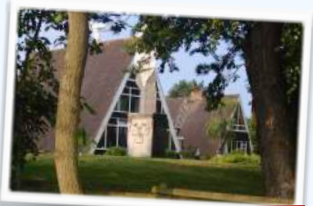
Dünenhäuser (Mehrbett) 135.- € inkl. Verpflegung