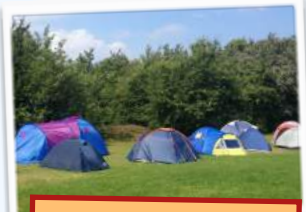
Camping Dünenhof 25.- €