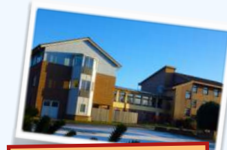
Sahlenburg (Mehrbett) 116.- € inkl. Frühstück