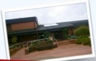
Dünenhofel (EZ & DZ) 265.- € inkl. Verpflegung